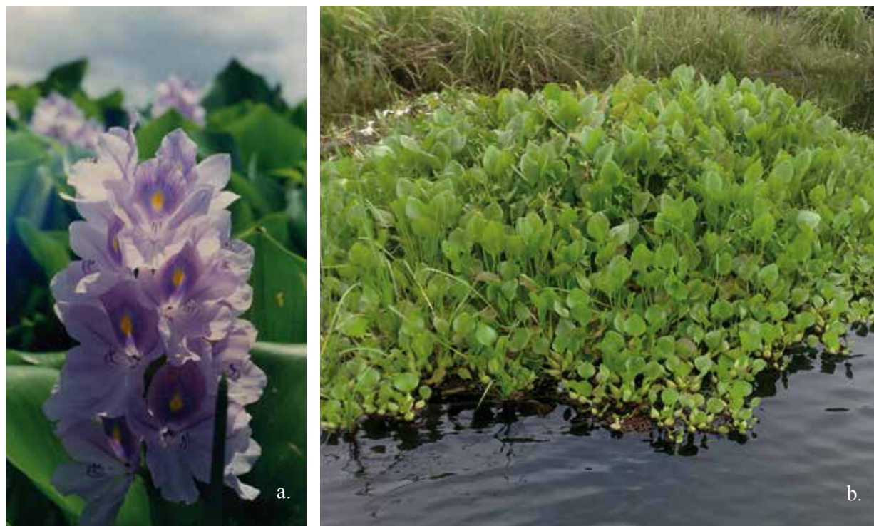
Figura 2. a) Eichhornia crassipes Mart. Solms. b) Embalsado de Eichhornia , las porciones externas pueden desprenderse y dispersarse a lo largo de cauces de ríos y lagunas interconectadas con ríos.

pueden tratarse con esta planta. Marinoff et al. (2006) enumeran los usos que le dan las comunidades consultadas en el Chaco argentino y en la India, donde se emplea desde hace siglos en la medicina ayurvédica (Oudhia 1999 a, b). En la cuenca del Orinoco en Venezuela es materia prima de la artesanía de la etnia Warao en el Delta, pero ya hace más de una década que se conoce su valor nutritivo y sus ventajas para el ganado sobre otros pastos forrajeros de los llanos (Rodríguez 1997, 2005). También en Colombia hay algunas experiencias de aprovechamiento como recurso forrajero, producción de papel, artesanía o biocombustible que son seguidas con interés en foros de internet, congresos y publicaciones, confirmando primordialmente su eficacia en el tratamiento de efluentes de la industria ganadera (Murgueitio 2003, Moreno et al. 2008), efluentes domésticos (Valderrama et al. 2003) y remoción de metales pesados, sólidos suspendidos y colorantes de la industria de la floricultura en este país, "... una alternativa fácil, ecológica y económica para limpiar las aguas" (Vásquez 2004).