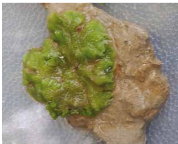
Figura 4. Ricciocarpus natans . Caño Dagua, Orinoquia colombiana.

Ahora bien, como ya hemos comentado, no todas las especies invasoras, es decir aquellas plantas cuyo centro de origen es otro, crecen y se reproducen hasta dominar el medio que ocupan convirtiéndose en maleza. Algunas, tal vez muchas, se establecen en el nuevo espacio geográfico y se naturalizan sin que apenas se advierta su presencia. Así sucede con Ricciocarpus natans , un briofito inconspicuo originario de Nueva Zelanda, común en la cuenca del Orinoco (Rial 2009, Rial y Lasso 1999) donde incluso suele ser confundido con Salvinia y Azolla (Figura 4). Esta hepática también puede reproducirse sexual o asexualmente por unión de gametos o fragmentación respectivamente. A pesar