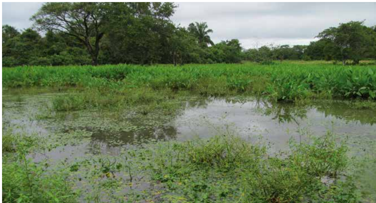
Figura 3. La composición de las comunidades vegetales acuáticas de los llanos inundables del Orinoco en Colombia y Venezuela son muy semejantes. En la foto colonias de Thalia geniculata , Sagittaria guayanensis y Caperonia palustris en los Llanos de Yopal (Casanare).

Podríamos decir que esta amplia distribución de las plantas vasculares acuáticas resulta por una parte de las diversas vías y mecanismos naturales (Cook 1987, Figuerola y Green 2002, Green et al. 2002, Santamaría 2002, Santamaría y Klaassen 2002, Boedeltje et al. 2004) e interconexión de los