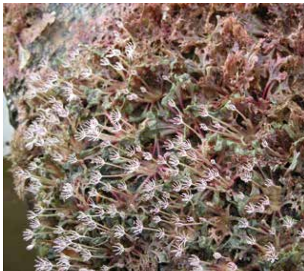
Figura 1. Podostemaceae endémica de Suramérica. Únicamente registrada en Brasil y Venezuela.

La distribución geográfica más amplia: cosmopolita o pantropical, se atribuye a las plantas acuáticas que han sido registradas en todo el planeta o en todos los grandes continentes. En algunos casos se conoce su área o rango nativo y en muchos otros no. Por ejemplo Eleocharis acicularis , conocida en Colombia como cebolleta de pantano, mara o piso, esta ciperácea habita tanto la región circumboreal como ecuatorial. Es considerada nativa en Venezuela (Briceño y Morillo 2006), en China (Wu 2001), en la Micronesia